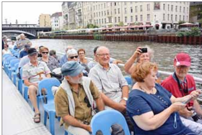
Besuch in Berlin: Fahrt auf der Spree