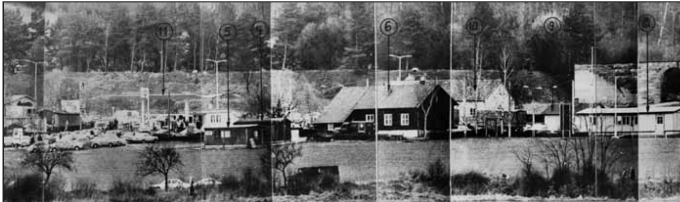
Grenzkontrollstelle Herleshausen, aufgenommen von dem B-Turm bei Göringen, Ende der 1970er Jahre.