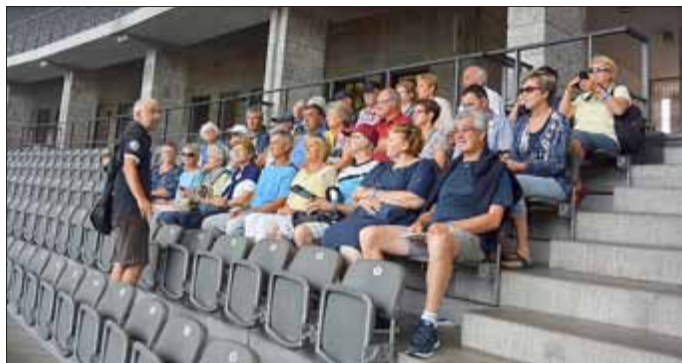
Besuch in Berlin: Olympiastadion