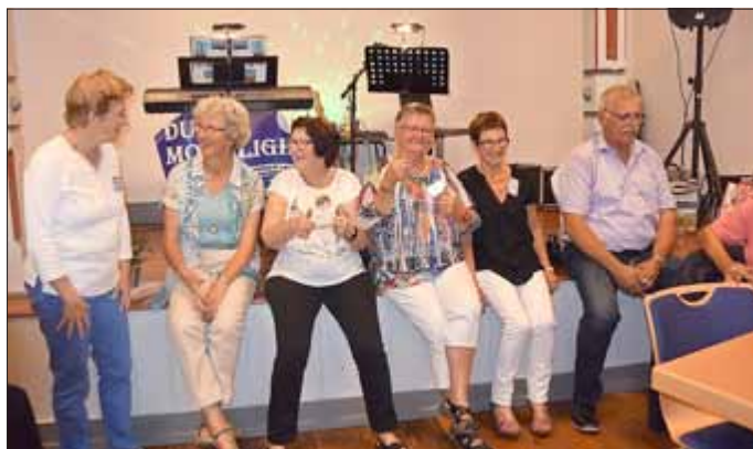
Fröhlicher Festabend in Nesselröden: Gemütliche Tanzpause

Diese Bilder und noch viel mehr auf dem Herbstfest am Sonntag, 12. 11.17